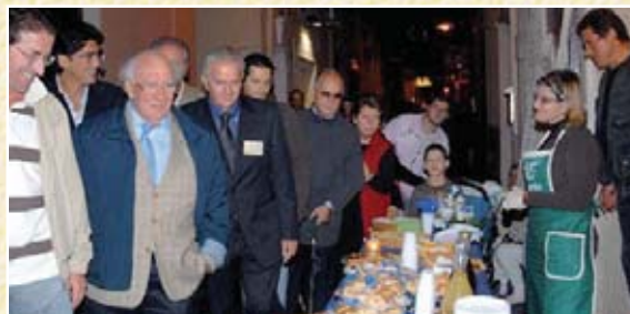
Le Vie di Gaeta 2008

Info: Ass. Gaetavola Tel. 333.1165814 - info@gaetavola.org Comune di Gaeta Tel. 0771.469465 - turismo@gaeta.it I.A.T. Ufficio Turistico Gaeta Tel. 0771.461165 Informare Tel. 0771.452518 - info@informaregaeta.it